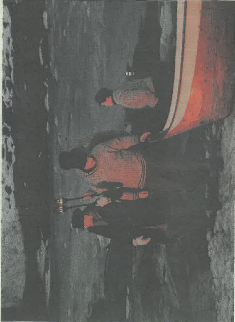
Fiskerne kommer hjem til heimstøa.