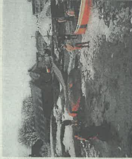
Sorg for dem som mistet sine, glede for dem som fikk dem hjem.