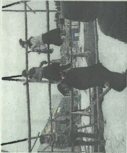
Alle måtte hjelpe til når fisken skulle på hjell.