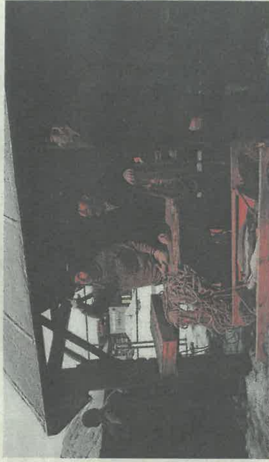
Prisdiskusjoner mellom fiskere og fiskeroppkjøpere kunne foregå med sterkt munnhuger.