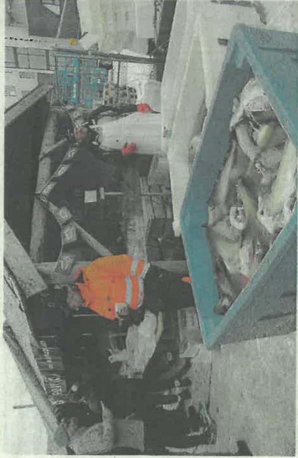
Skreien hadde fokus på arrangementet.