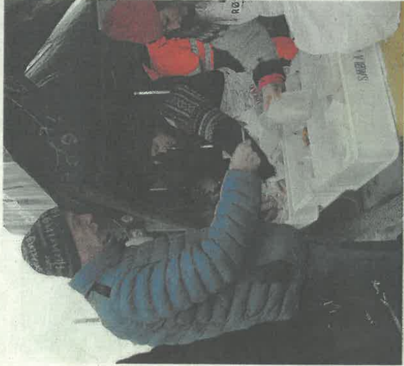
Handelen gikk strykende i bodene.