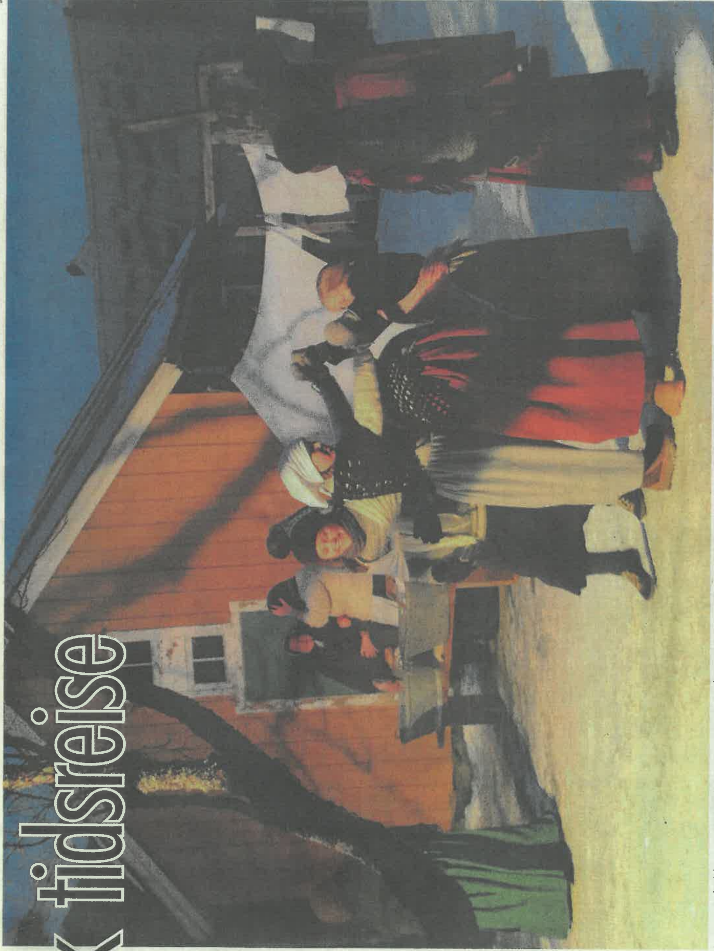
Latter og sladder i et raust miljø speiles hos kvinnene som tar klesvasken i bakgården.