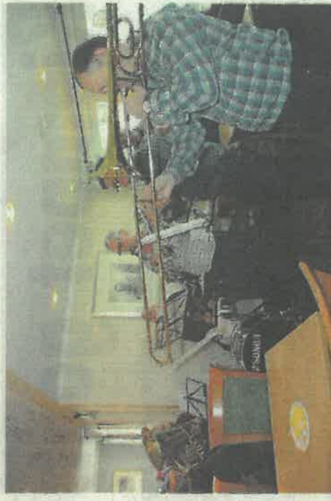
Brassbandet fra Sparbu spilte på hotellet.