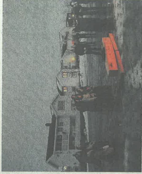
Begravelsen til fiskeren ble gjennomført med prest og blåseinstrumenter.