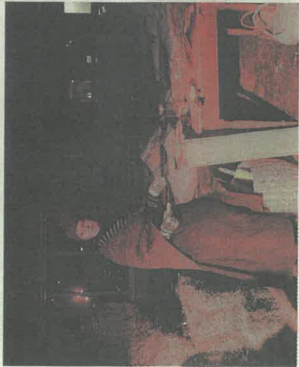
På markedet var spekteret bredt. Alt fra speksild til hjemmebrent var til salgs.