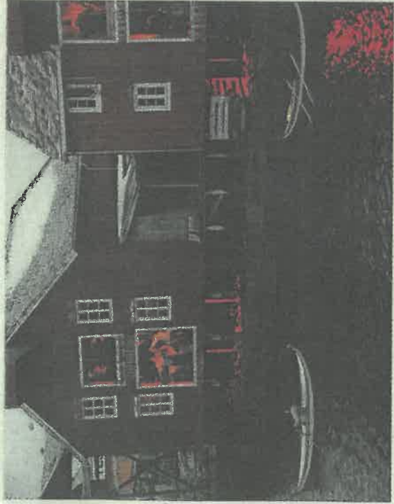
Fiskerene tor inn til bryggene med fangsten.