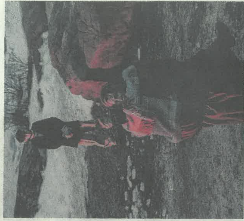
Sorg over tapet av ektemann og far var en sterk opplevelse.